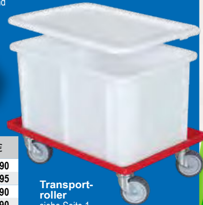
Transportroller siehe Seite 1