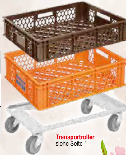
Transportroller siehe Seite 1